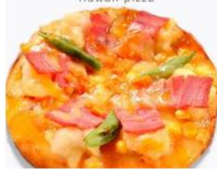
豪華夏威夷 Hawaii pizza