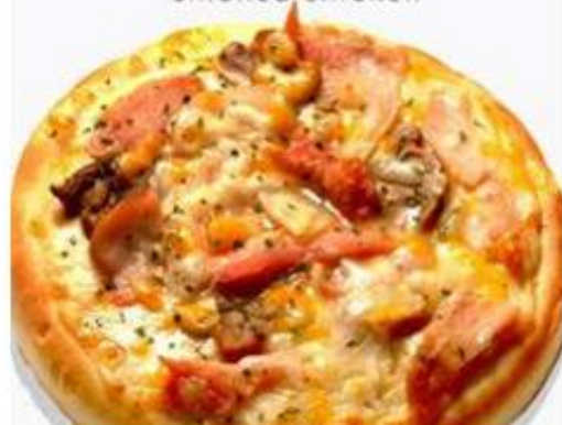
草菇煙燻嫩雞 smoked chicken