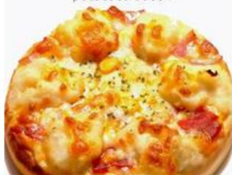
奶焗薯泥培根 potatoes bacon