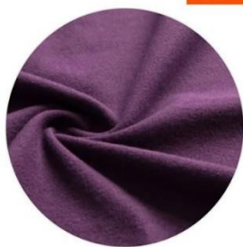
WIWI發熱衣 熱加倍刷毛