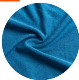
日牌發熱衣 無刷毛