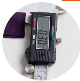
WIWI發熱衣 厚度僅 0.30mm