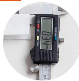
四張抽取式衛生紙 厚度 0.34mm

註：因批布及成衣製作過程可能會造成商品些許落差，測驗儀器準確度測試環境人為操作等因素，實驗結果會有稍微差異。