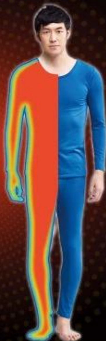
第三代 遠紅外線溫灸刷毛發熱衣