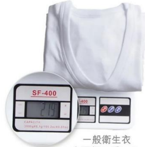
一般衛生衣 女圓領M重219g