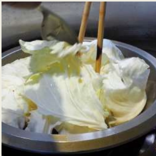
6.將高麗菜下鍋拌炒