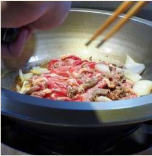
1.底油麻油進行熱油