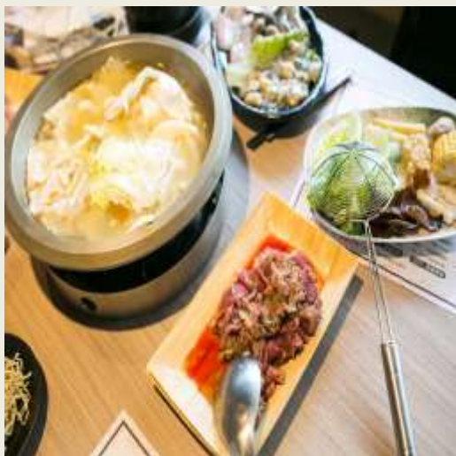
9.準備享用美味火鍋