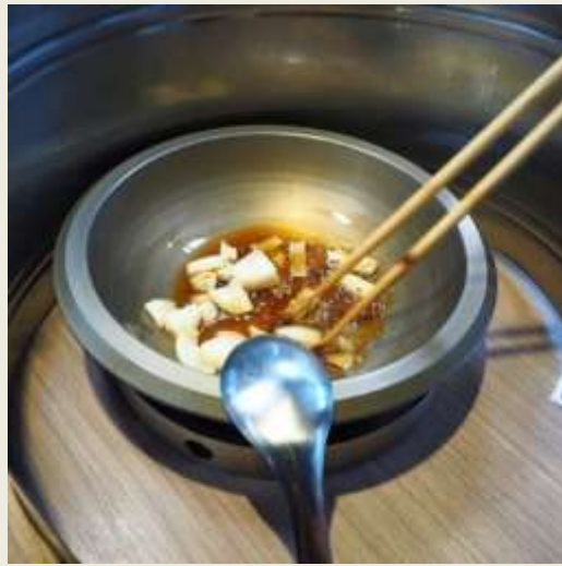
2.炒料下鍋進行爆香