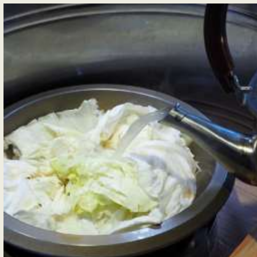
8.倒入每日現熬湯頭